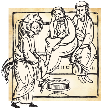
Сьомий день. Четвер